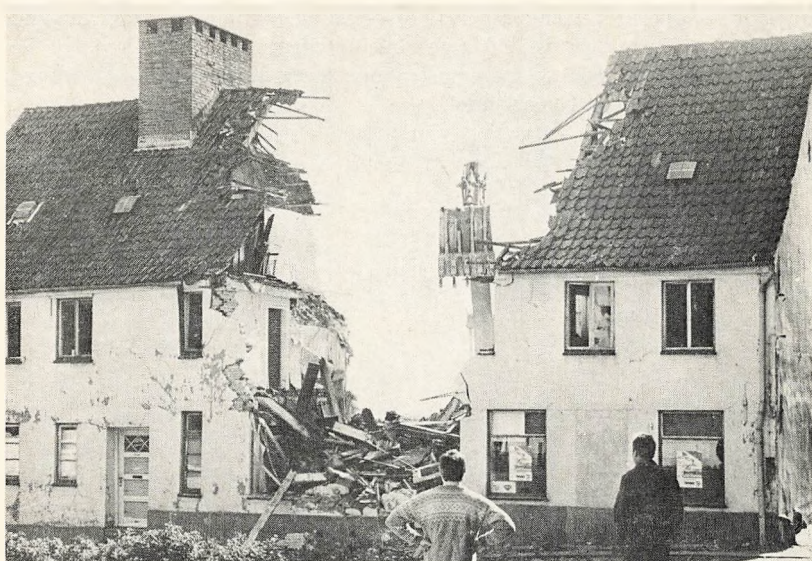
Der ryddes til byggeri. Der er ca. 1 times forløb mellem de to billeder. Måtte byggeriet få samme tempo!