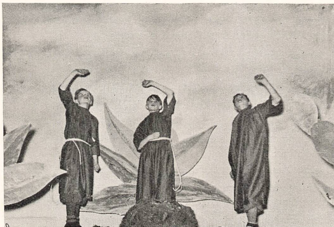
Scene fra Julespillet »Julen har bragt —«.

Mandag den 25. November var der med Titlen »En Skole med Musik i« Radioudsendelse fra Holte Gymnasiums Musikskole, hvor Lærere gav Forklaringer og Elever behandlede forskellige Instrumenter.