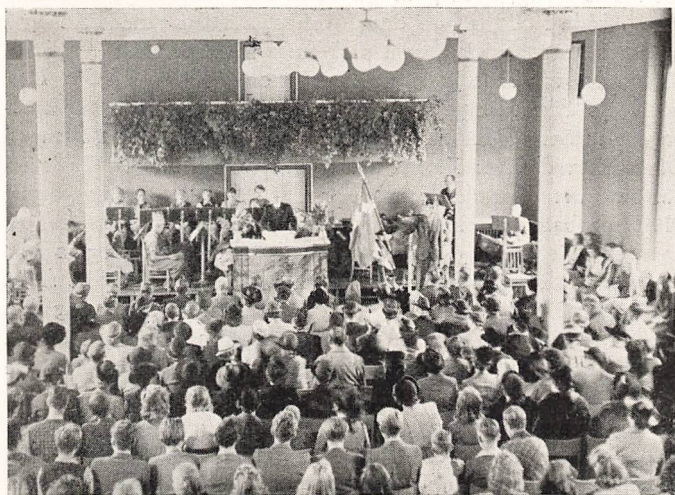
Fra Festen i Anledning af Hs. Maj. Kongens 70 Aars Fødselsdag.

Senere kaldtes vore Konger Skjoldunger . Og de fleste af Jer har jo allerede i Historietimerne hørt om en Række dygtige Konger med de samme Egenskaber, som vore Forfædre tillagde Skjold, lige fra Gudfred , vor første historisk kendte Konge for 1100 År siden, den Konge, der byggede det ældste Dannevirke