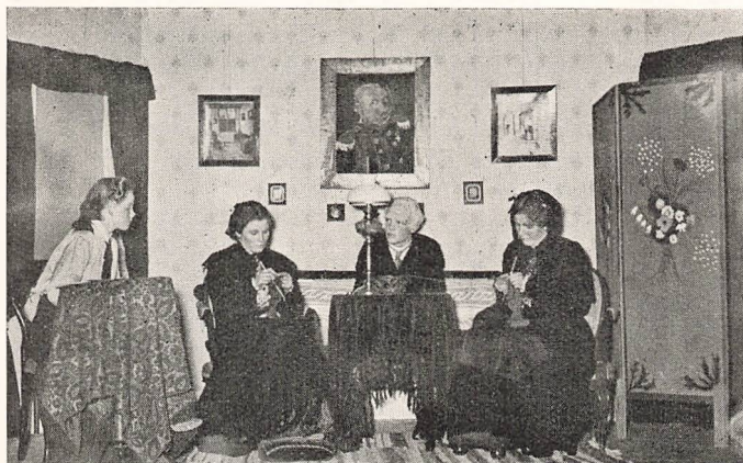
Scene fra »Skærmydsler«.