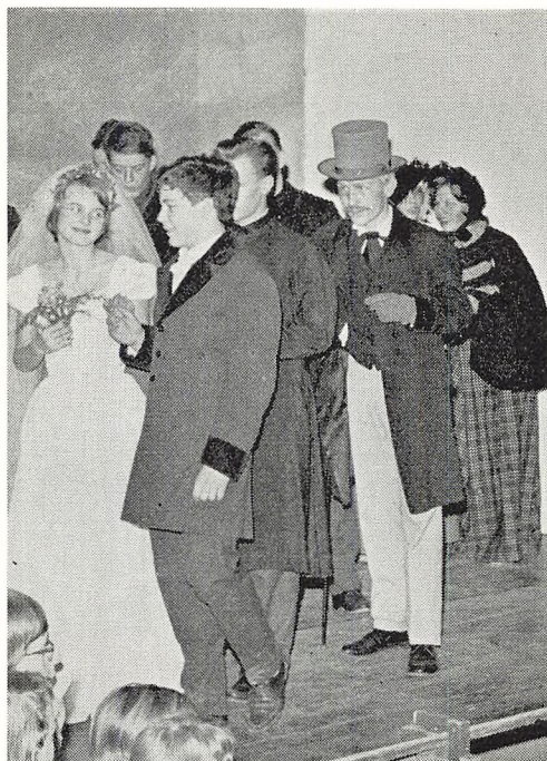
Slutoptrin af »Klokkestøberen«.