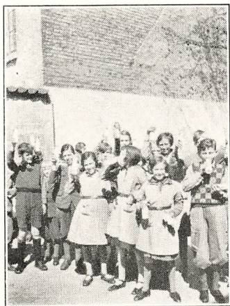
M æ l k!