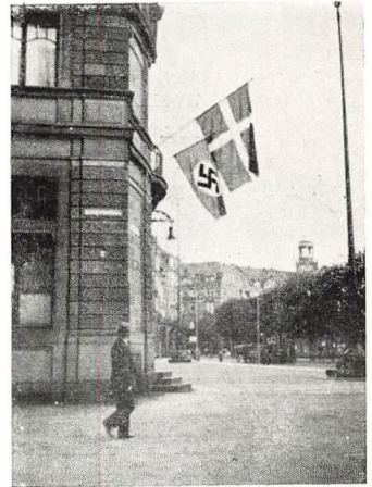
Mannheim: De to Korsflag.