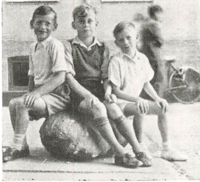
Den nye Siddeplads.