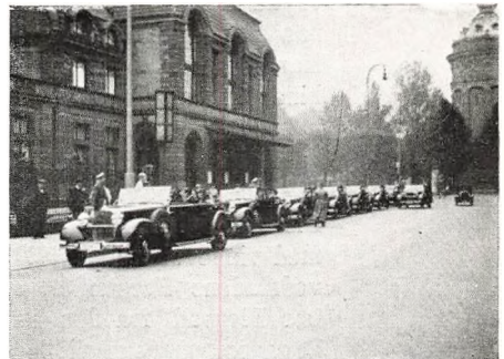
Mannheim: De 8 Biler ved Rosengarten.