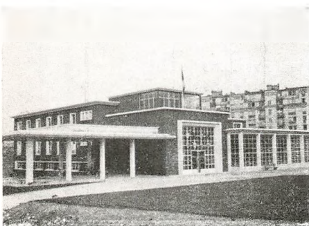
Paris: Auberge de Jeunesse.

gaarden i Frankfurt og Holdet fik Besked om at tage med næste Tog. Vi mødtes da et Par Timer efter, da jeg steg paa i Darmstadt. Nu fik jeg at vide, at der alligevel havde været en reserveret Vogn, som blev sat til Toget umiddelbart før Afgang og straks befolket af Holdet. I sidste Øjeblik blev det dog kommanderet ud af Vognen, da Togføreren ikke vilde tillade, at det rejste uden at have Lederen med, som havde Billetter, Pas og andre Papirer. Ved denne Lejlighed knækkede en Cello Halsen. Den var ikke indrettet til at taale den grove Behandling ved den gentagne Ind- og Ud-stigning. Den Mulighed, at selve Lederen skulde blive borte, var man ikke indstillet paa, men nu var vi da samlede igen efter Forskrækkelsen, en Erfaring rigere, men sultne. Der var endnu lidt