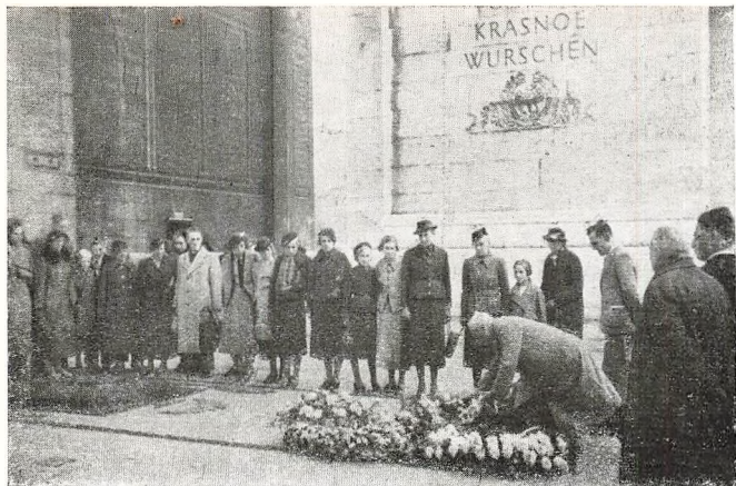
Paris: Den ukendte Soldats Grav.