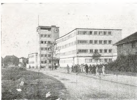
Frankfurt: Haus der Jugend.