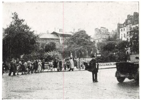
Paris: I Gadelivet.

I lidt fugtigt Vejr, der plettede de hvide Strømper, gik vi hen til „Maison Rouge“ paa Place Kleber. Efter Dagens mange Sindsbevægelser og med friske Indtryk af nazitysk Stramhed og Marchtrit føltes det helt beroligende at færdes i franske Omgivelser. Sproget om os var lige Dele Tysk og Fransk, stærkt isprængt den lokale Dialekt „Elsässerdytch“, Tempo og Gangart var helt fransk — sorgløst slentrende. Først Kl. 21 kunde vi danse ind i Salen for et festklædt og fornemt, men noget faatalligt Publikum. Samtlige Konsuler med Damer havde givet Møde, Pressen var repræsenteret ved flere Redaktører, desuden var der Repræsentanter for Byraadet og for militære og civile Myndigheder. Bifaldet var hjerteligt, og man forsikrede