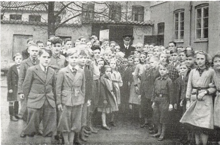
Prins Knud paa Besøg.

Søndag 10. Oktober: Legationen havde venligst lovet os at sørge for reserveret Vogn, men da Meddelelsen herom indeholdt en forkert Togtid, tog jeg ud til Banen for at undersøge Sagen. Da man ikke havde Kendskab til vor Rejserute, var Vognen bestilt til en anden Rute. Det lykkedes efter en Del Vrøvl at faa Sagen ordnet. Ligeledes overbeviste jeg mig om, at den bestilte Lastbil til Bagagen vilde komme. Man var efterhaanden blevet noget mistroisk overfor de elskelige Franskmænds Nonchalance. Efter Middagen tog vi alle ind til Hotel des Invalides. De to Museer blev gennemgaaede; Interessen samlede sig navnlig om Minderne fra Napoleonstiden og Verdenskrigen. Vi sluttede med et Besøg ved den store Kejsers Grav. Selv Nutidens mest nøgterne Børn maa et Øjeblik slippe Tanken om Biler og Sport for at beundre dette højtidsfulde Gravmæle. Efter Aftensmaden begyndte Pakningen, medens Damerne smurte Ostemad til Turen. Det var et Held, at vi nu skulde af Sted, for Herberget blev indtaget af Horder af