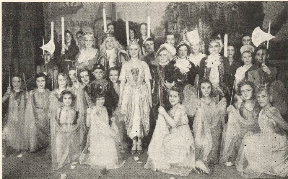
„Tornerose“. Skolefesten 1940.