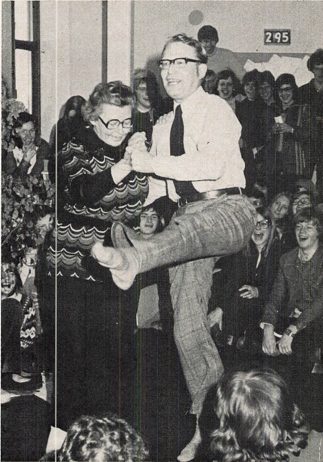
Afdansning på 3g'ernes sidste skoledag