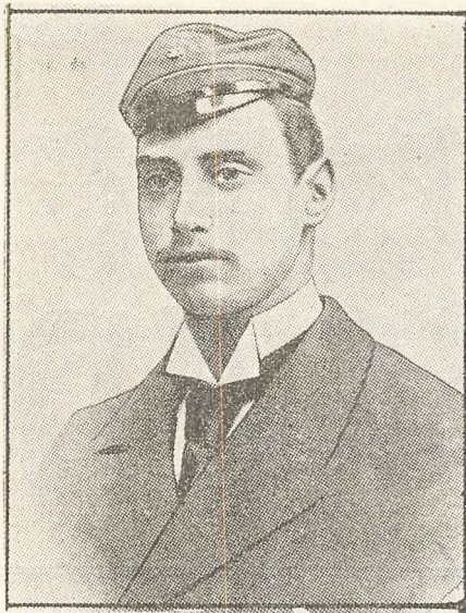
Kong Christian X. som Student for 25 Aar siden.