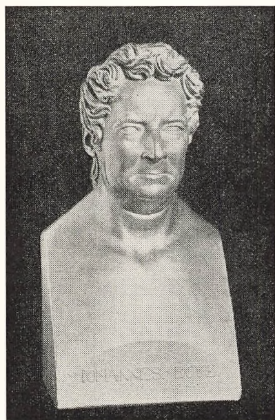
Buste tilhørende Det nationalhistoriske Museum paa Frederiksborg

Fornøjelser« : Fornøjelser, der kan erhverves »uden at forvolde Mangel af Ejendomme, Sundhed og Tilfredshed og altsaa ikke afhænge for meget af udvortes Ting«. En Haandværksmand vil være lykkelig, hvis han kan »overgive sig til rolige Sindsfornøjelser og opløfte sig over det daglige Trivielle og smage de Fornøjelser, der alene er anstændige for en udødelig Siel«. — Nogen virkelig Forstaaelse af sociale Spørgsmaal har han imidlertid ikke. Han anser det for ganske rimeligt, at en meget stor Del af Menneskeheden maa opofre sig, for at en lille Part af den kan leve i Luksus; men den større Part kan opnaa nogen »Lyksalighed« gennem Oplysning. — Derfor er det hans Anskuelse, at Religionsundervisningen bør indskrænkes og anlægges paa en helt anden Maade end ren Udenadslæren, og han foreslaar Undervisning i Naturvidenskab,