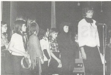
Minikoret med kattejammerrock

Den tid er forbi, da børnesange kun var kattekillinger og pruheste. Minikoret lagde ud med en sang om hvordan det er at kunne li' noget som alle de andre ikke synes, der er noget ved. Så kom en opførelse af kattejammerrock og endelig fik vi lidt om "hende, der altid driller" - bissetøsen - som selv sagde lidt om hvad det var, der fik hende til at gøre det. "Bare folk de vi' la' vær' med at stille deres sko på mine tær".