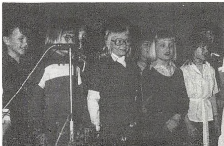
Lilliputkoret fra børnehaveklasserne

Lilliputterne gik til sagen med en eventyrlig sangglæde. Selv om de ikke fik megen hjælp af højttaleranlægget, var det helt klart, at de nød at være med i koncerten.