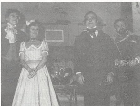
... det er koret i baggrunden

- desværre ikke lige den, han skulle have stemt i med. Selv med en aldersforskel på ikke under 40 år var der her den samme glæde ved at synge og spille komedie, som hos lilliputterne. Viva la musica.