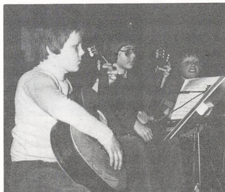
Tre fra guitarorkestret

Til gengæld blev de bløde klange fra guitar-spillerne så fint støttet af forstærkeren, at man denne gang virkelig fik fornemmelse af det fine samspil, der præger gruppens spil.