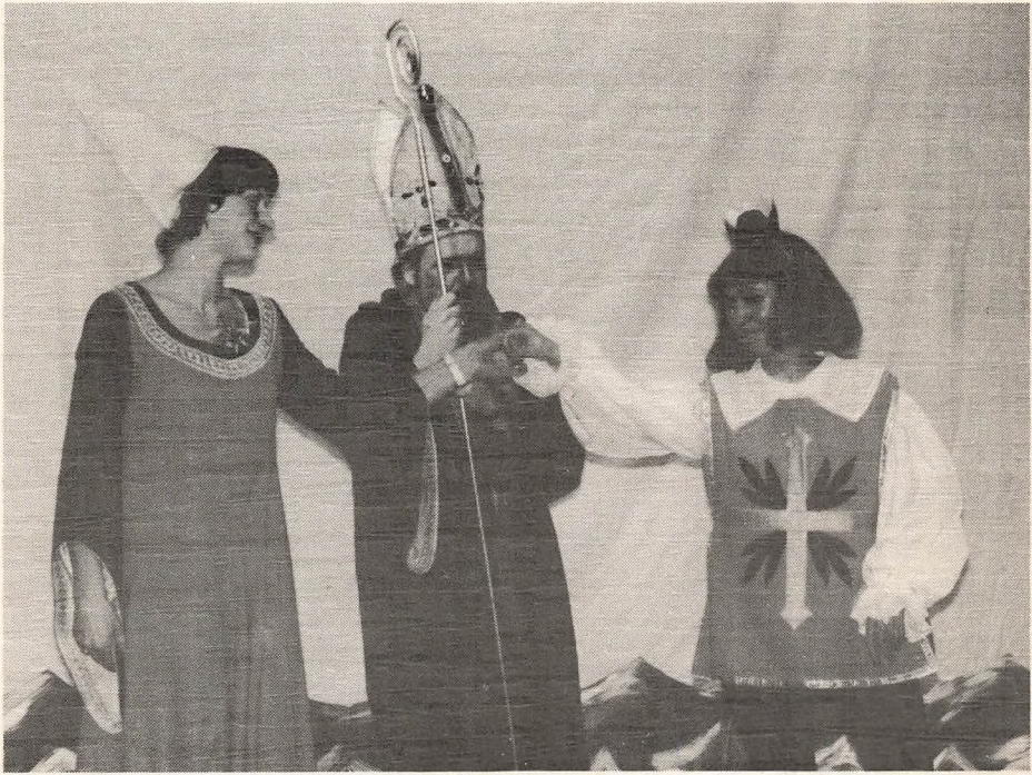
FRA EN FESTLIG AFTEN