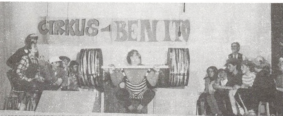
Mr. STRONG» i akzion