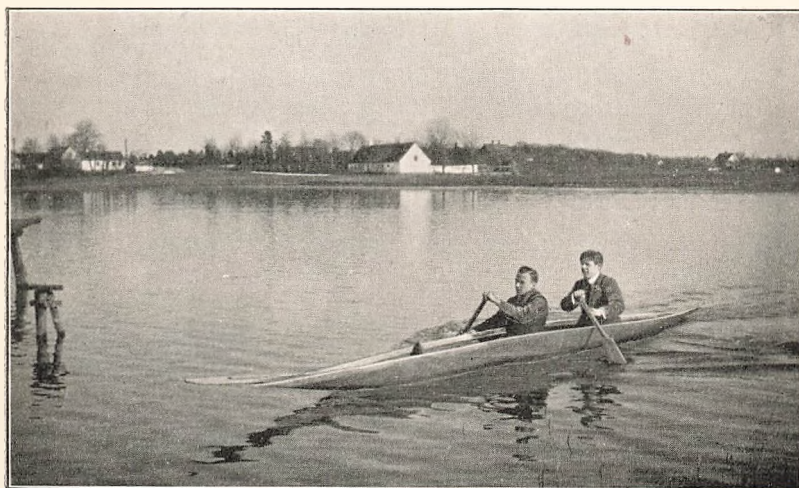
Fra Birkerød Sø.