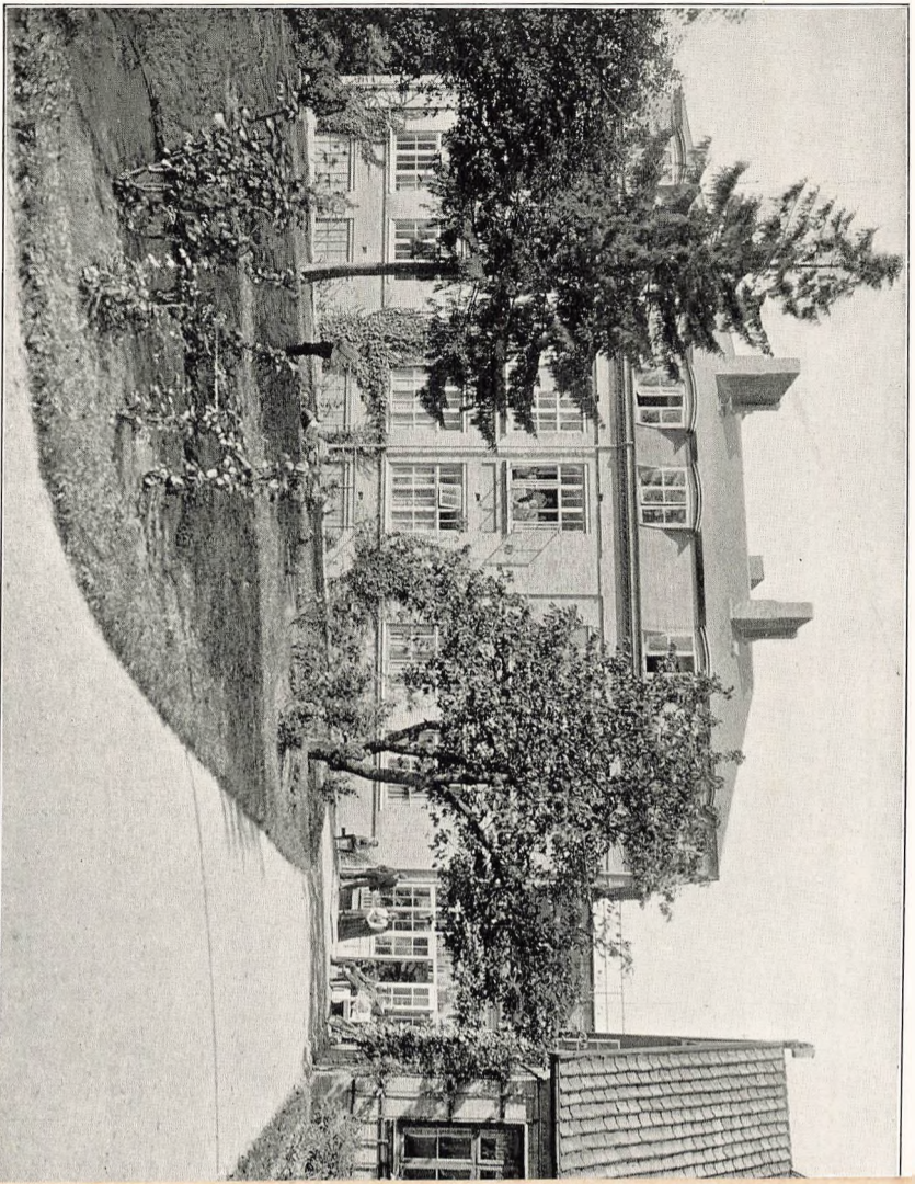
Den nye Skolebygning.

Pensionatseleverne. Til de større og mindre Festligheder, som afholdes i Skolens Festsal, er alle Skolens Elever med deres Forældre og Søkende velkomne.