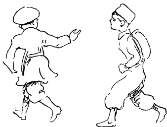
Vignetter af Alfred Schmidt.