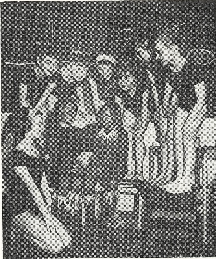
Fra „Drømmen om Robinson“: Fredag og Lørdag omgivet af yndige ildfluer.