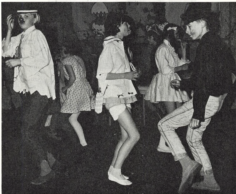
Dansen går ved karnevallet for de store.

Ved februar-elevrådsmødet blev følgende forslag vedtaget: Oprettelse af frugtbod, oprettelse af rygelokale og afgangsklasserne oppe i frikvartererne. Disse forslag gik videre til lærerrådsmødet. Ved elevrådsmødet blev der tillige nedsat et ordensudvalg. Dette ud-