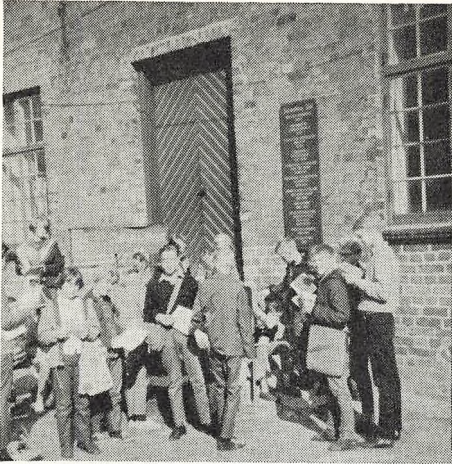
Lejrskolestudie ved Sønderborg Slot

lære os. Og det forekom os, at vi var kommet til at stå hinanden nærmere. For kammeratskabet er et sådant forhold af uvurderlig betydning.