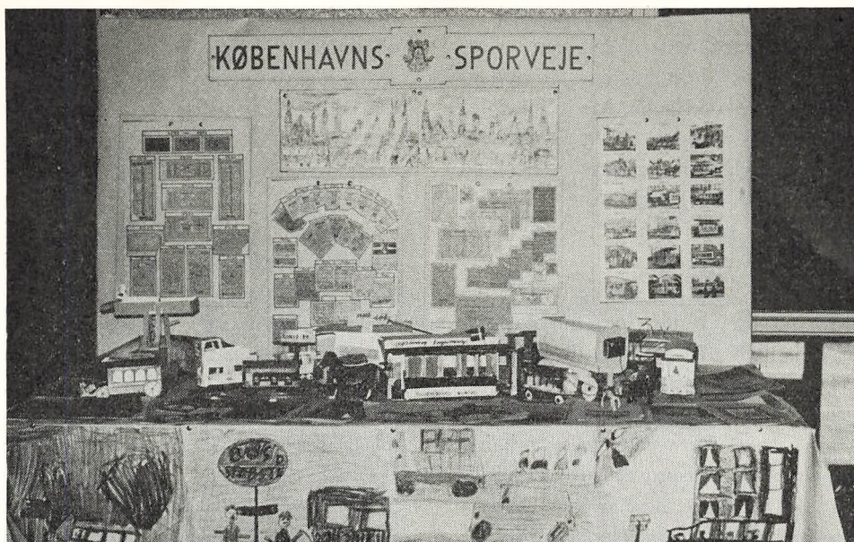
En meget levende historisk sporvognsopstilling.

kort stund, hvor alle betaget har været helt stille, er forbi, man går til dagens arbejde en oplevelse rigere.