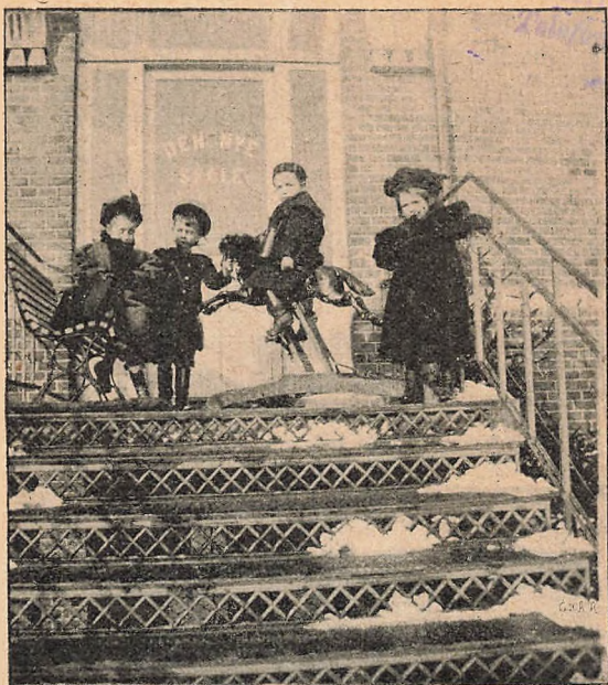
De fire mindste med Le Cheval Hygiënique.