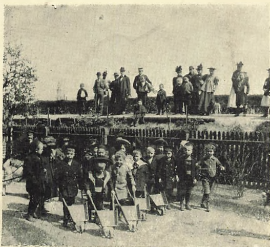
Parti af Legepladsen ud mod Dosseringen.