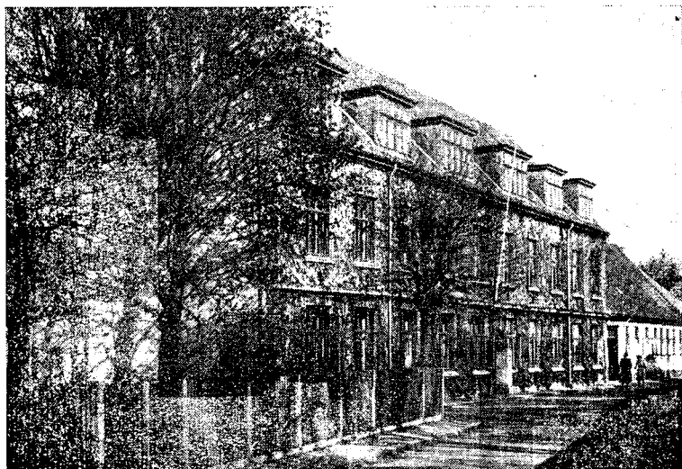
Mellem- og Realskolen.

Forskellige Klasser aflagde som sædvanligt i Aarets Løb interessante og lærerige Besøg paa Museet, Gasværket, Vandværket og Bryggeriet. Skolen takker for den Elskværdighed og Beredvilighed, med hvilken Eleverne disse Steder bliver modtaget og vejledet.