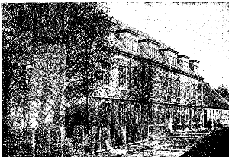
Mellem- og Realskolen

Forskellige Klasser aflagde som sædvanlig i Aarets Løb interessante og lærerige Besøg paa Museet, Gasværket, Vandværket, Bryggeriet, Andelsmejeriet og Thisted Dampmølle. Skolen takker for den Elskværdighed og Beredvillighed, med hvilken Eleverne disse Steder bliver modtaget og vejledet.