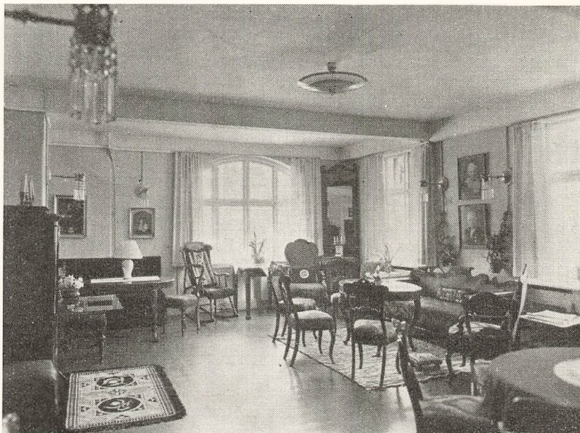
Dagligstue i Skolehjemmet for Piger