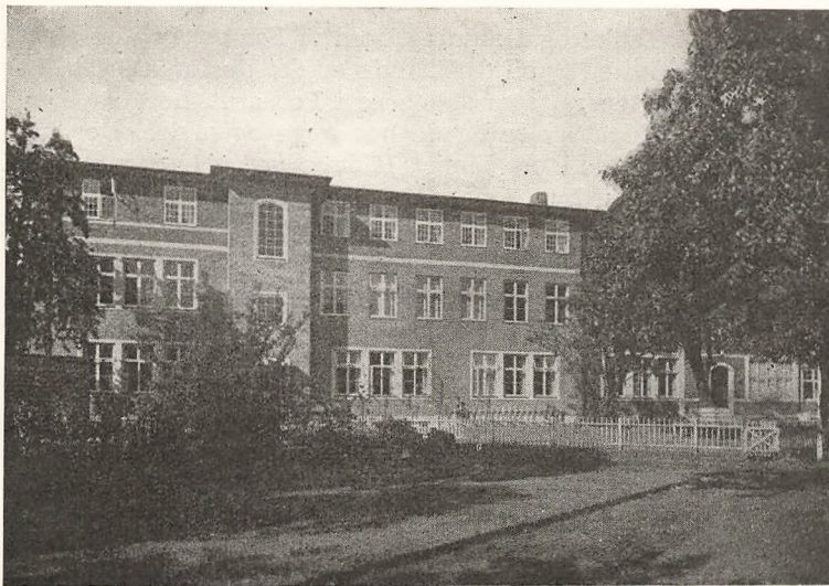
Den nye Bygning, set fra Haven