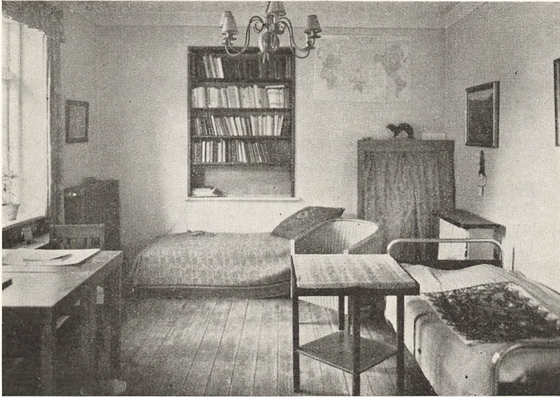
Elevværelse i Skolehjemmet for Drengene

Dersom Fordyrelsen af alle Levnedsmidler og Brændsel fortsat vil vedvare, maa vi forbeholde os Ret til i Skoleaarets Løb at regulere Opholdsbetalingen i samme Forhold, som Pensionatsvirk-somheder, der arbejder under lignende Forhold som vi, finder det fornødent.