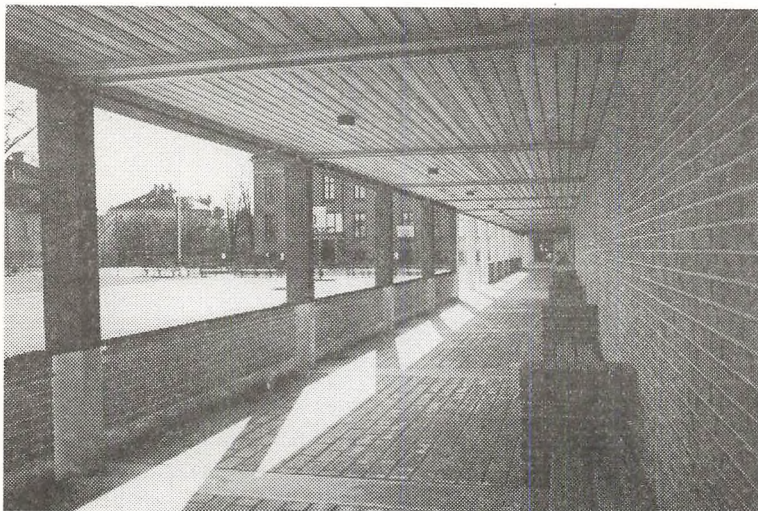
Pergolaen ved de nye gymnastiksale.

uomklædte elever at notere som fraværende. Konsekvenserne af et stort antal fraværelser kan, som ved andre fag, skabe problemer ved oprykning eller indstilling til eksamen.