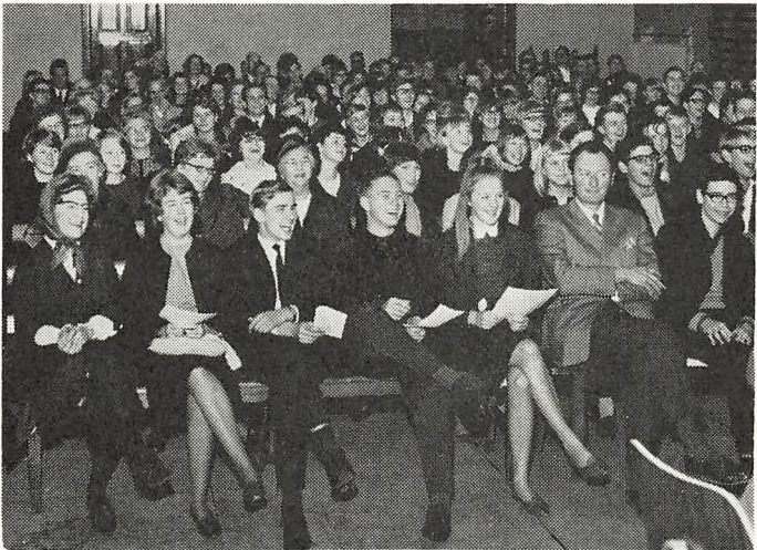
Mener de det?