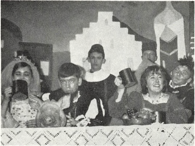
Det gamle spil om Enhver.