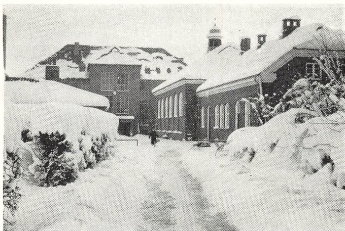
15. november 1965! Eller 15. april 1966?