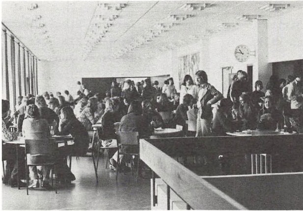
Elevernes kantine i den ny bygning.