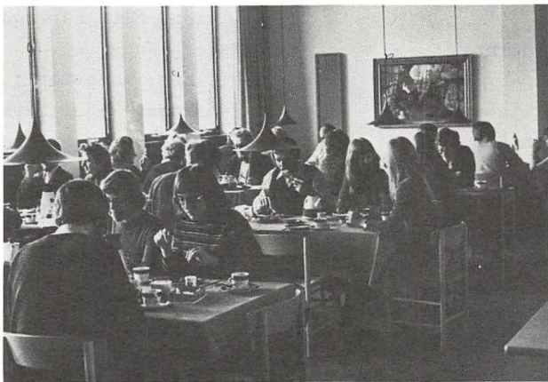
Lærernes kantine i den ny bygning.