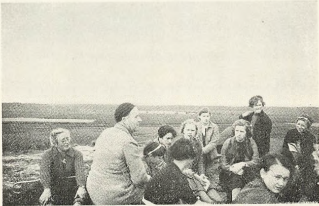
Hvil paa Randbøl Hede.