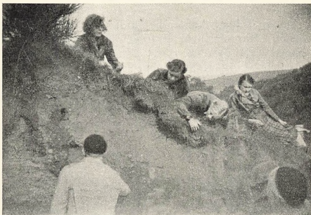
Arbejde i Grusgraven.

Gymnasicelever, 56 den udvidede Svømmeprøve for Mellemskolen og 72 Frisvømmerprøven for Mellem-skolen.