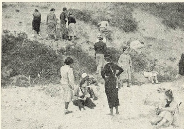
Hvil ved Læsa.

2. Dags Morgen Kl. 8 kørte vi til Almindingen, hvor vi paa en et Par Timers Spadseretur besøgte de historiske Steder Gamleborg og Lilleborg og de pragtfulde Sprækkedale Ekkodalen og Fuglesangsrenden. Paa Grund af al for daarlig Tid maatte vi bryde op for at