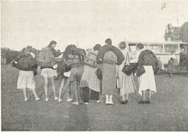
Før Afrejsen, med fuld Oppakning.