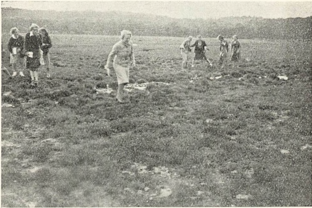
Paa Strandengen ved Jægerspris.

Kulhus og nærmeste Omegn egner sig med sit afvekslende Landskab fortrinligt til Lejrskole, idet man her har Lejlighed til at iagttage forskellige Landskabstyper, f. Eks. Morænebakkeland, hævet Havbund og den pragtfulde Skuldelev Aas, foruden forskellige Kysttyper (Klintekyst, Strandeng, og mod Nord Klitkysten ved Kattegat).