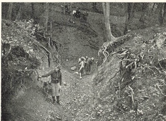
Erosionsslugt i Ermelunden.

Orientering ved Hjælp af Kort, og simple Maaleøvelser — trigonometrisk Afstands- og Højdemaaing ved Hjælp af Sigteapparat — (II Gsp.) har skullet tjene til at sikre Anvendelsen af Kortet og uddybe Forstaaelsen af Sammenhængen mellem Kortbillede og Landskab. Kendskab til Undersøgelsesmetoder er ogsaa opøvet praktisk ved Tegning af Landskabs- og Jordbundsprofiler.