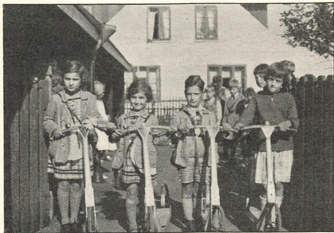
Paa Løbehjul til Skole.