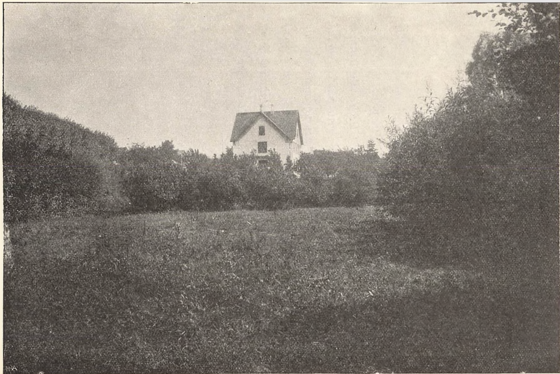
FRA SKOLENS ENG.