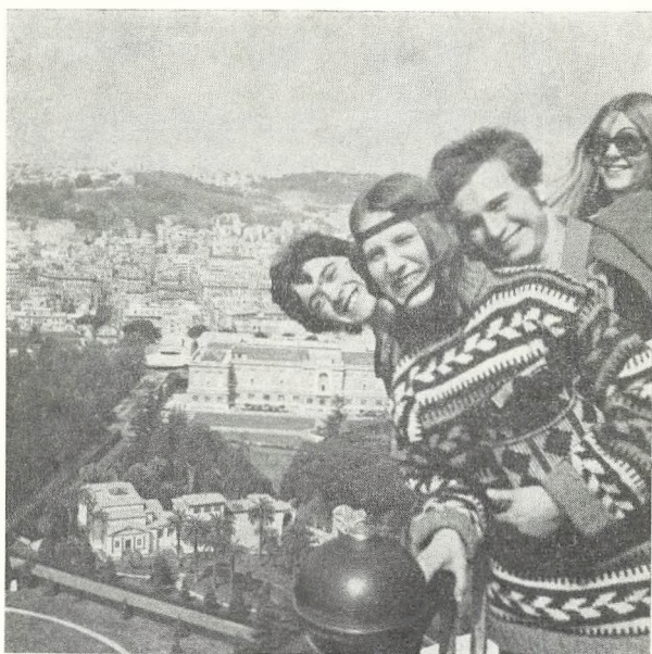
Fra 2 nsa's tur til Rom.