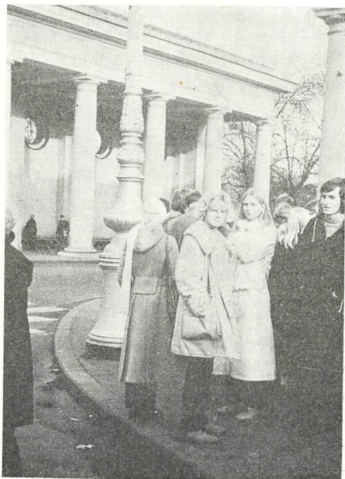
Fra 3 ay's tur til Leningrad.

Hotellet, vi bor på, er bygget af unge for unge. Det hedder Druschba og det betyder venskab. En aften sidder vi alle sammen på et af værelserne og drikker vodka eller russisk