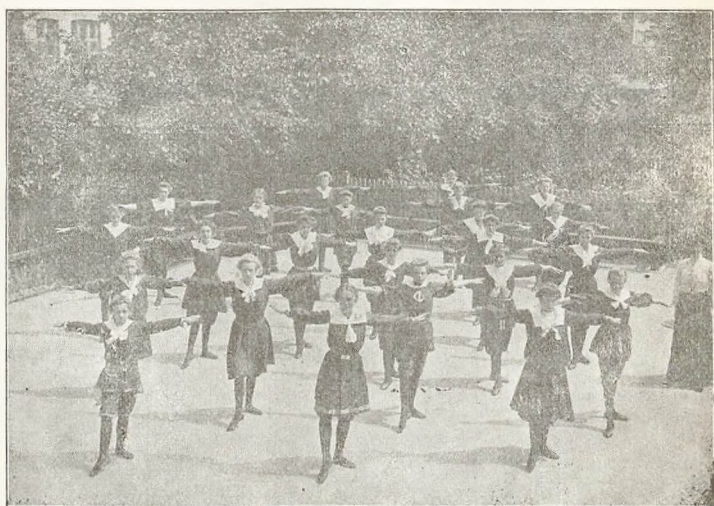
Øvelser paa Legepladsen.

Gymnastik: 10—4 Klasse: Efter det blandede danske System. I Maanederne fra Maj—Oktober har de forskellige Klasser i Gymnastiktimerne spillet Langbold, dels paa Legepladsen og dels i Frederiksberg Have.