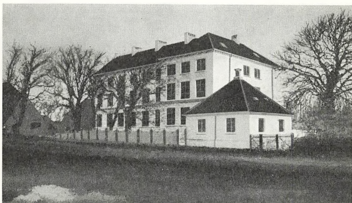
Marselisborg Gymnasium 1917