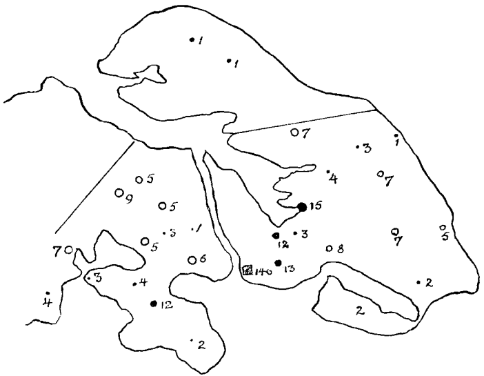
Søndersborg Statsskoles Opländ.