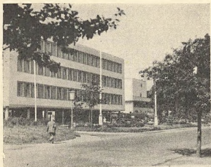
Regeringsbygningen i Bonn