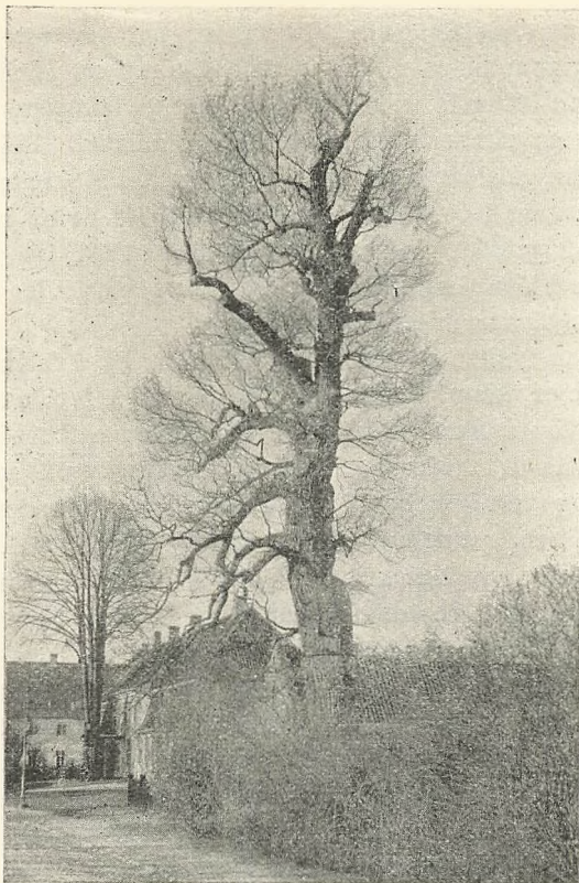
Store-Pil 1901. Set fra Nord.

for ethvert Jordarbejde, herunder tillige Indhegningen; en saadan var nødvendig, dels for at forhindre Folk i at mishandle Træet yderligere og dels for at undgaa, at Jorden, der nu er bleven ophakket og gødet omkring Stammen, hvor der overalt viste sig Smaarødder, skulde blive trampet fast, og derved danne en Skorpe, gennem hvilken Luft og Regnvand ikke vilde formaa at trænge ned til Rødderne.