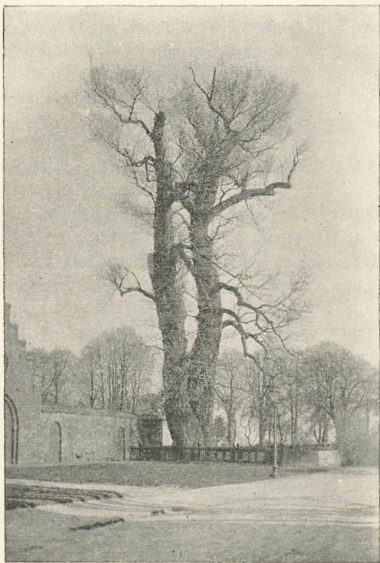
Store-Pil 1901. Set fra Sydøst.

Disciplenes Langboldspil ophørte, blev de paa den Side af Vejen værende Græsplæner, der tildels vare ødelagte under Restavrerings-Arbejdet, gødede, gravede og til-saaede med perennerende Plænegræs, hvormed de sidste Arbejder for at give den gamle historiske Kæmpe en sorgløs Alderdom afsluttedes. Men for at ikke det hele Arbejde skal være spildt, er det nødvendigt at pleje den, dels ved jevnlig at tilføre Rødderne Ernæringsstof, hvor dette kan ske uden at skade dem, og dels