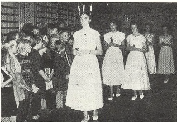
Luciaoptøget ved iuleafslutningen.

Det skønne træ var atter i år en gave fra skolenævnet.