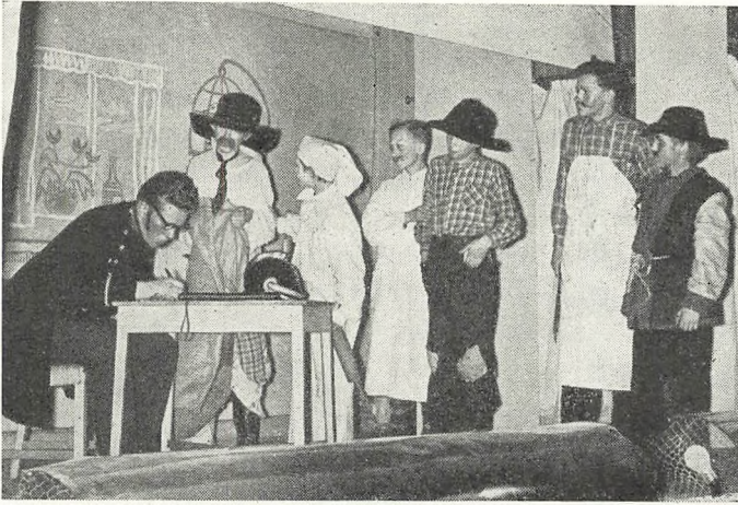
„Retten er sat“ i Kardemomme by.