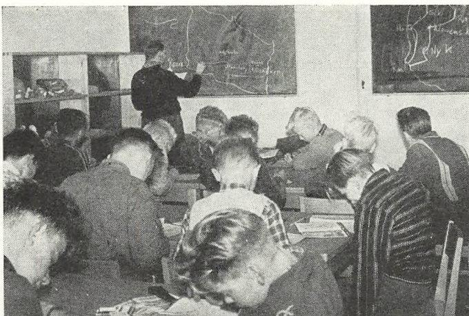
I skolestuen på lejrskolen.