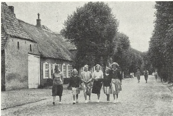
På den lange gade i Møgeltonder.

Blommehaven, Blommestien, Blushøjvej, Borghaven fra 23 og 26, Bærhaven, Danhaven fra 27 og 32, Druehaven, Englodden, Gl. Køge Landevej fra Folehaven til kommunegrænsen, Grønnehave Allé, Harrestrup Allé, Humlehaven fra 43 og 38, Kirsebærhaven, Stakhaven, Stakledet, Urtehaven ulige nr. fra Frugthaven til kommunegrænsen samt lige nr. fra 24, Vigerslevvej fra 281 og 282, Vinhaven fra 1 til 53, Østergårds Allé. — Haveforeningerne: „Gl. Enghave“, Folehaven; „Parkvænget“, Gl. Køge Landevej; „Solhøj“, Gl. Køge Landevej.