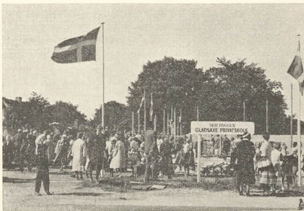
Gæster på vej ind til grundstensnedlæggelsen 2/9-59

som ikke skyldes sygdom, kan kun finde sted efter forud indhentet tilladelse fra skolen og frarådes som helhed af denne. Når en elev møder efter sygdom, skal der i elevens meddelelsesbog være anført grunden til fraværet og angives den tid, eleven har været fraværende. Sygdom, der skønnes at blive af over tre dages varighed, bedes telefonisk eller skriftligt meddelt skolen. Ved mere end én times fritagelse for gymnastik kræves lægeattest.