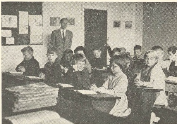
1. klasse i „Bagsværd“

er på alle alderstrin kr. 46,00 pr. måned (juli fri). Søkende har modera-tion (for 2 børn betales kr. 82,00 pr. måned, for 3 børn kr. 113,00). Ele-verne får opkrævning med hjem, og der betales forud for hver måned senest den 1. i måneden. For august måneds vedkommende skal beta-ling finde sted senest den 20. august. Der kan betales kontant (aftalte penge i lukket kuvert med angivelse udenpå af måned samt elevens navn og klasse), på check (i lukket kuvert med nævnte angivelser) eller giro (på blanketten angives samme oplysninger). Brændselspenge ud-gør kr. 46,00 årligt, der betales med kr. 23,00 den 1. november og kr. 23,00 den 1. marts. Indmeldelsesgebyr udgør kr. 25,00. Ved evt. udmel-delse betales for den måned, hvori udmeldelsen finder sted, samt for de to næste.