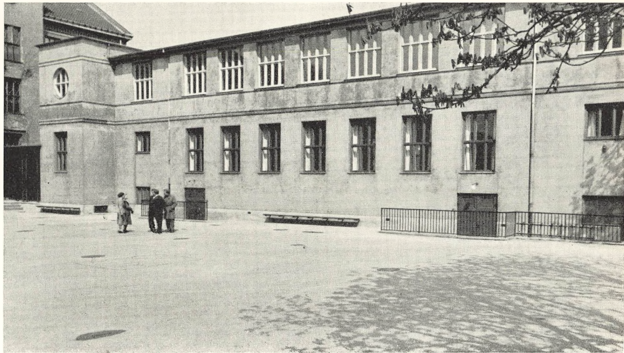
De nye lokaler over gymnastiksalen vil formentlig kunne tages i brug ved det kommende skoleårs begyndelse.