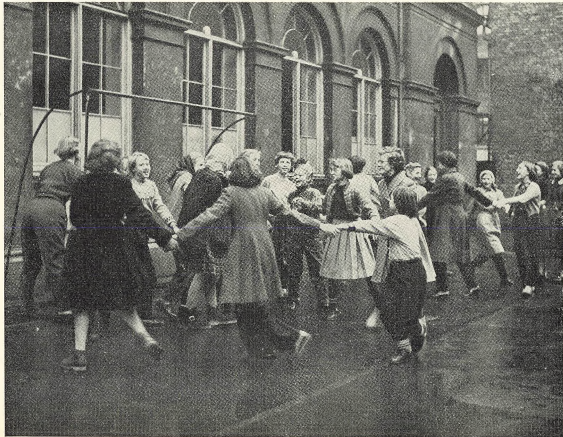
Billede fra legepladsen.