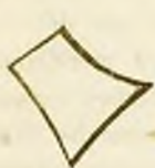
være Forindien eller

Saa mener man at skulle forbedre fremgangsmaaden ved at lade landene ind- (eller om-) tegne i (eller om) visse geometriske figurer eller lader sig kanske nøie med disse geometriske figurer selv, i hvilket sidste tilfælde man nærmer sig fremgangsmaaden A. 1) . Man lader f. eks.