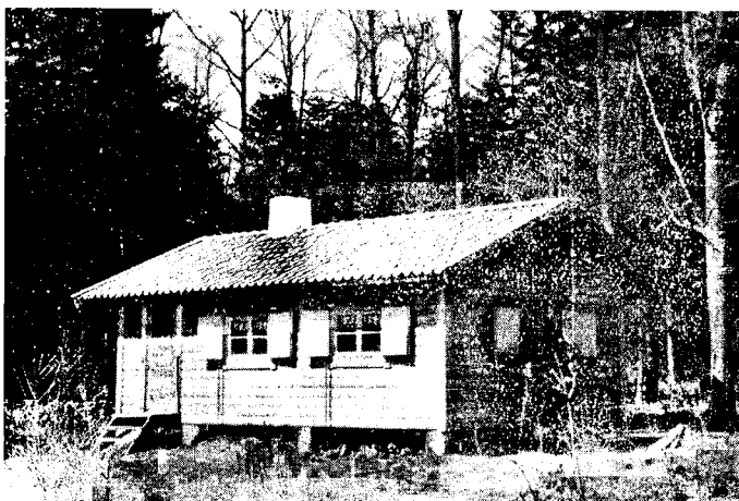
LÄROVERKETS SPORTSTUGA (EXTERIÖR)

Allt sedan införandet av de obligatoriska idrottsdagarna har det känts såsom ett stort behov att hava ett mål för utflykterna och ett ställe, där lärjungarna kunde vila ut och få något varmt att dricka. En lämplig plats, belägen c:a 6 km. från Vänersborg, fanns å stadens mark vid Grönvik, alldeles invid Vänern. Möjligheter finnas där under sommaren till bad, under vintern till skridsko-, skid- och kälkåkning.