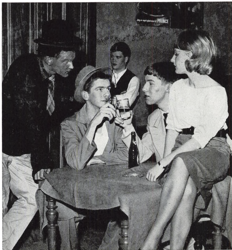
Fra II g's opførelse af Saroyan: »Livet er jo dejligt«