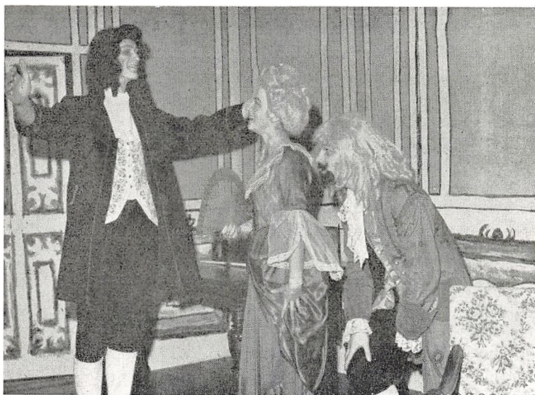
Fra IIg's opførelse af Tartuffe