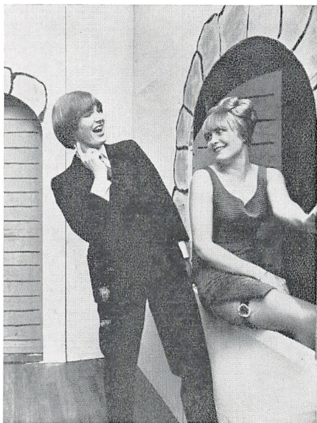
Fra 2. g's opførelse af »De tre klaphatte«.