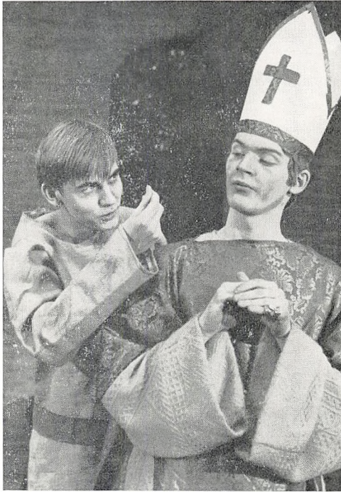
Fra 2. g's opførelse af Anouilh: Becket.