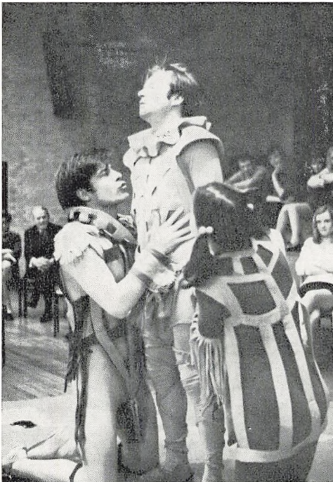
Fra Bandens opførelse af »Cirkus Militæ«