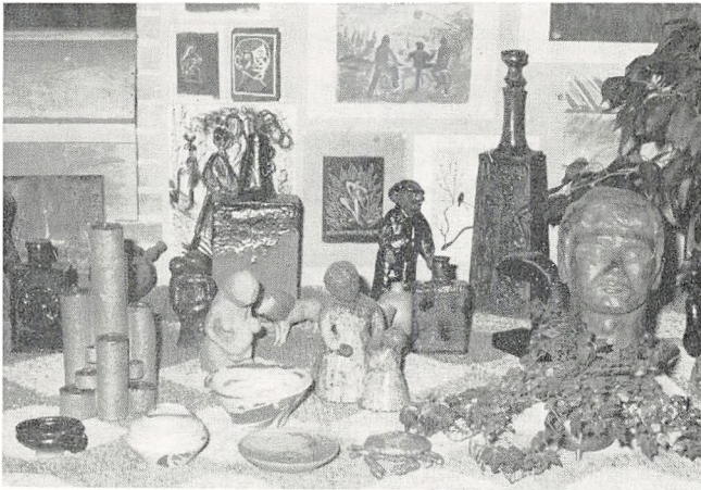
Fra en udstilling af elevarbejder

publikationer udgivet af arbejdsdirektoratet: Studie- og erhvervsvalget — Orientering for gymnasiet (1969), Grenvalget i gymnasiet (1969) og Valget i 2. real (1969).