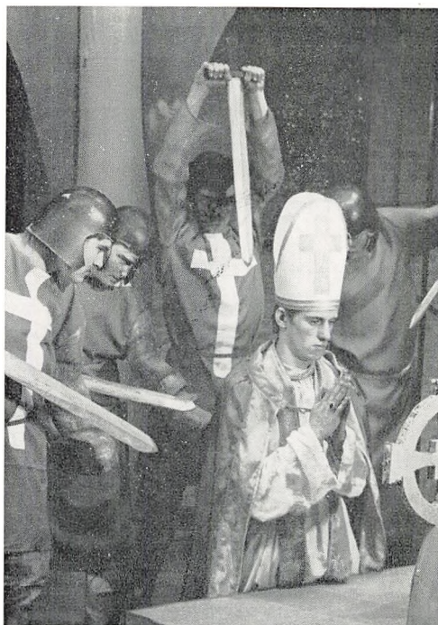
Fra 2. g's opførelse af Anouilh: Becket.