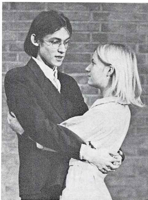
Fra 2.g's opførelse af »Melodien, der blev væk«