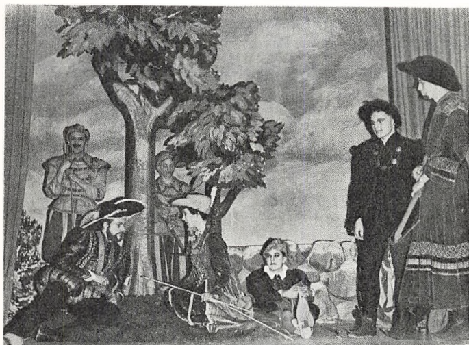
Scene fra opførelsen af »Cant«.