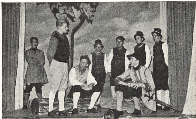
Scene fra opførelsen af »Frihed er det bedste guld«.