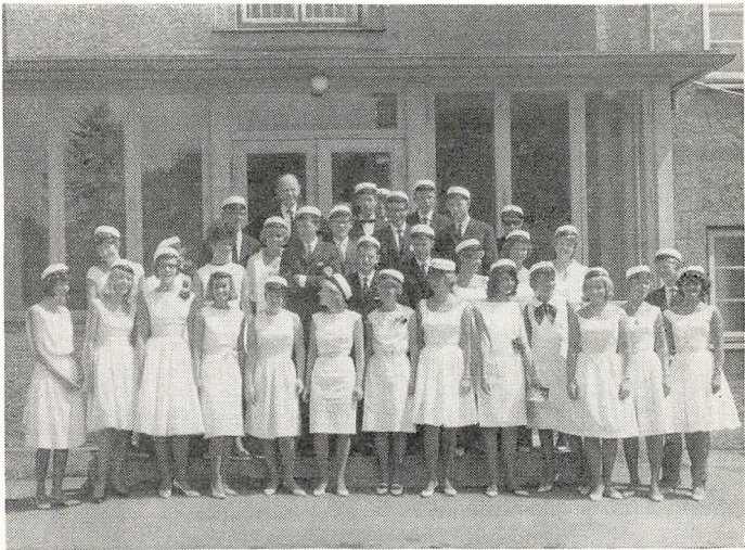
De nysproglige studenter 1963.