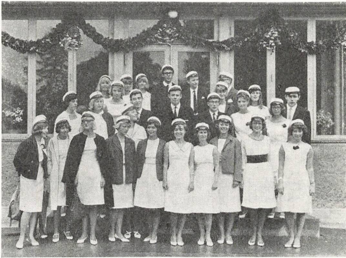
De nysproglige studenter 1964.