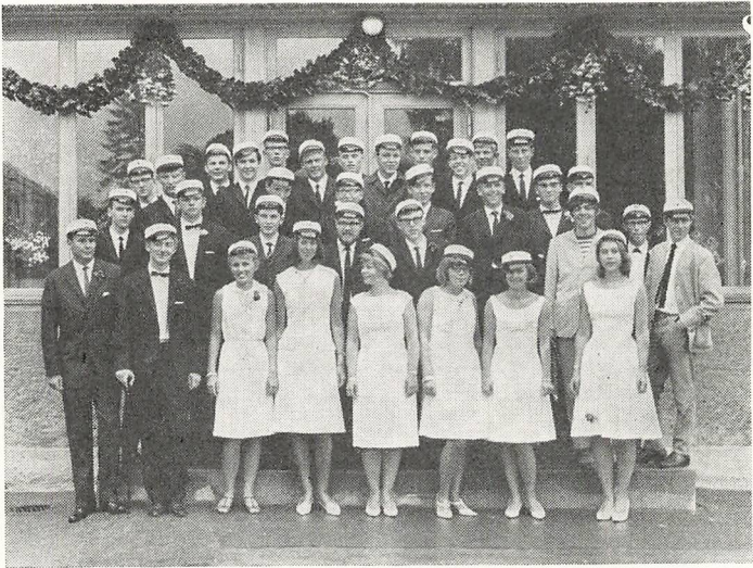
De matematiske studenter 1964.