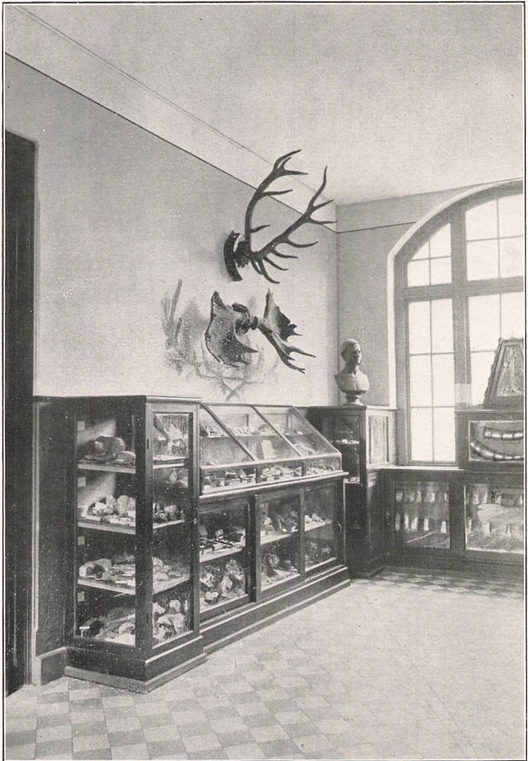
Geologisk Hjemstavnsamling og et Hjørne af Oldsamlingen med Thriges Buste.